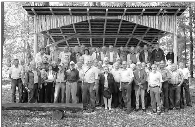
Gäste der forstlichen Exkursion

Kürzlich kam es wieder zum Besuch von Forstexperten aus dem In- und Ausland um die Wälder in Anrode kennenzulernen. Eine ungarische Delegation mit leitenden Forstleuten war in Thüringen zu Gast und besuchte dabei unter anderem den Dörnaer Wald.