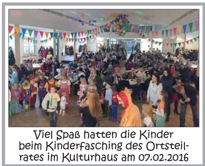
Viel Spaß hatten die Kinder beim Kinderfasching des Ortsteilrates im Kulturhaus am 07.02.2016